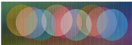
Carlos Cruz-Diez 2007, Physichromie n°1511 300 x 100 cm

L'Espace Meyer Zafra ramène à Paris une sélection des œuvres qui ont été exposées à la Fondation Atlas Sztuki de Lodz, en Pologne, exposition qui a réuni une soixantaine d'œuvres cinétiques et géométriques abstraites pendant l'été 2009.