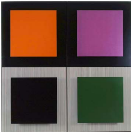
Jesus Soto 1997, Noir et couleurs Acrylique, bois et métal, 203 x 203 x 17 cm

Exposition du 16 septembre au 25 octobre 2009 Vernissage le jeudi 17 septembre à partir de 18h30