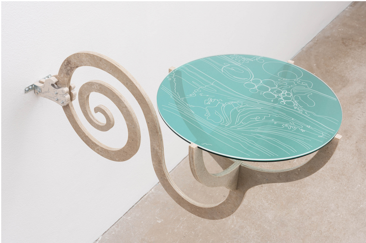
Lena Marie Emrich Wishing well (Spiral) , 2023, 38 x 82 x 38 cm (15 x 32,3 x 15 in) Natural Acrylic Stone, Plexiglas, Mirror foil