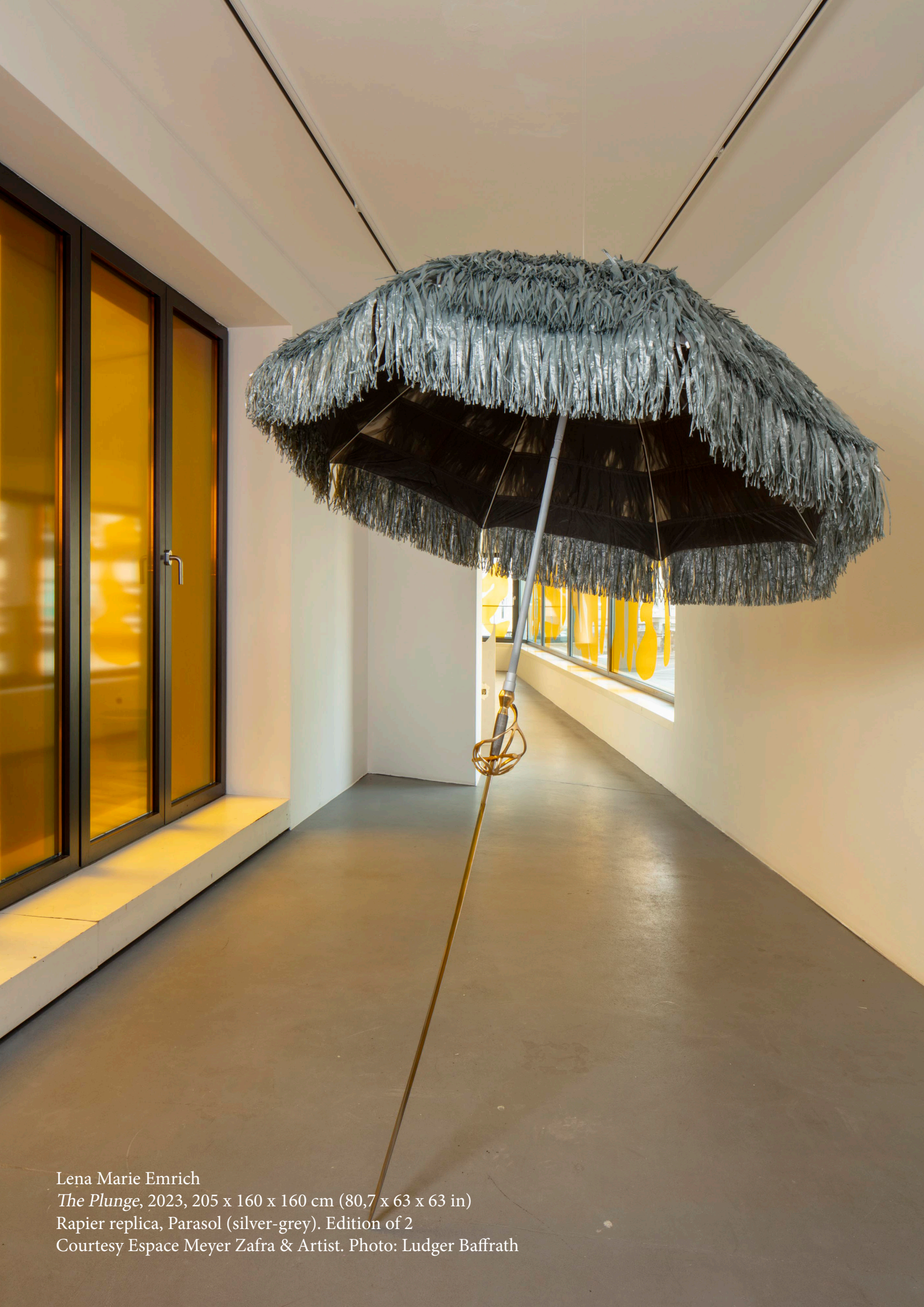
Lena Marie Emrich The Plunge , 2023, 205 x 160 x 160 cm (80,7 x 63 x 63 in) Rapier replica, Parasol (silver-grey). Edition of 2